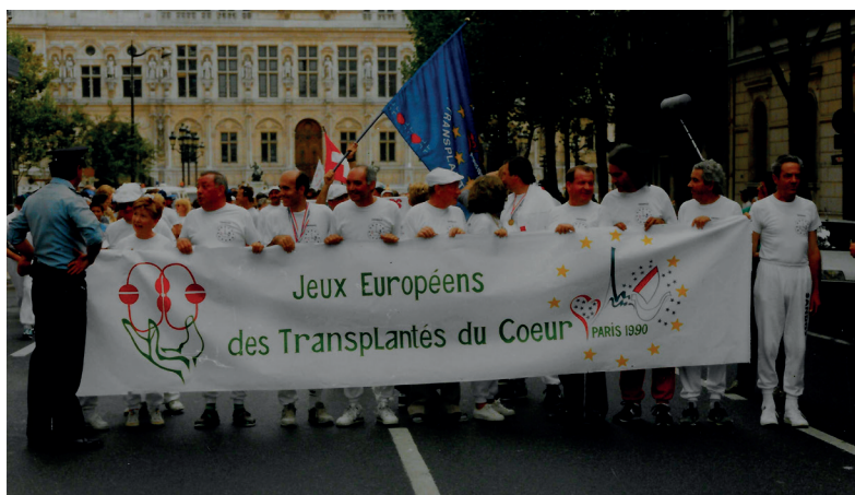
La tête du cortège lors des Jeux de Paris en 1990

D'un départ modeste en 1989, les Jeux sont devenus de plus en plus populaires au fil des ans et ils regroupent maintenant quelques 600 athlètes et supporters des Associations Membres.