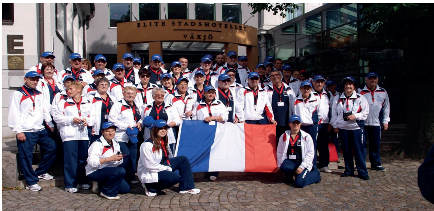
La délégation française lors des Jeux de 2010 en Suède à VÄXJÖ