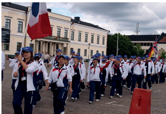
La délégation française