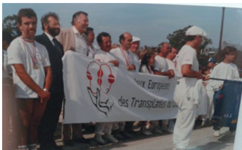
Cérémonie d'ouverture des Jeux avec la présence du Professeur Cabrol

Le Professeur Cabrol est le pre- mier transplanteur à avoir tenté la greffe cardiaque en France