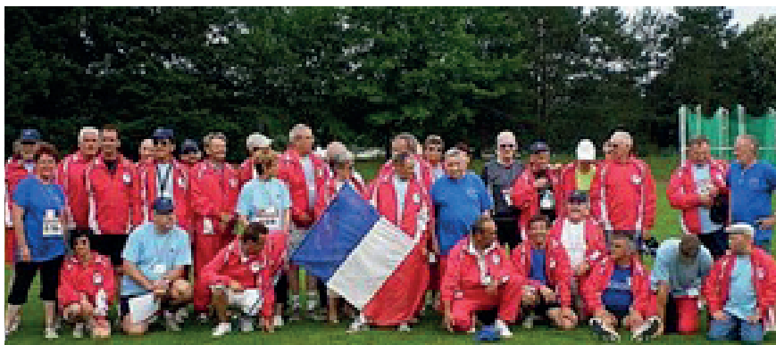
Une partie de la délégation française !

Nous avons eu la chance que la Ville de VICHY ait mis à notre disposition toutes ses infrastructures sportives.